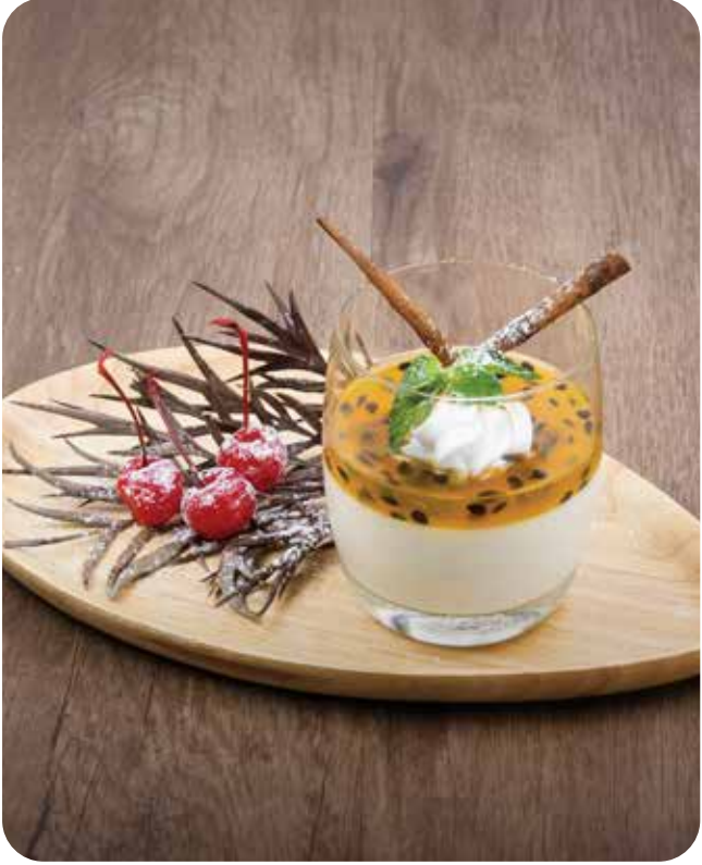
Caffè Del Museo

6. White chocolate panna cotta with passion fruit jam Caffè del Museo, an Italian cuisine, serve white and soft panna cotta topped with home-made passion fruit jam created by Toscana Valley's bakery shop. ป๊านนาคอตต้าเสาวรส ห้องอาหารอิตาเลียนคาเฟ่เดลมุซซิโอเสิร์ฟป๊านนาคอตต้าสีขาวนวลและเนื้อสัมผัสที่เนียนนุ่มราดด้วยแยมเสาวรสโฮมเมดที่รังสรรค์โดยร้านเบเกอรี่ในทอสคานาวาล์เล่แห่งนี้