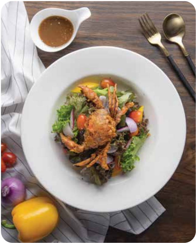
Caffè Del Museo

1. Deep fried soft shell crab salad with balsamic dressing Fresh organic salad from Toscana Valley's vegetable garden served with balsamic dressing and crispy big soft shell crab at Caffè del Museo, an Italian cuisine.