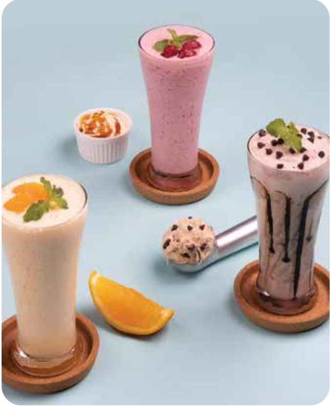
VINO Caffè and Wine Bar

4. Fruit x ice cream shake Double delicious when fruits mixed with ice cream such as banana - chocolate chip, raspberry - caramel and orange - vanilla to make your enjoyable Khao Yai trip at VINO café.